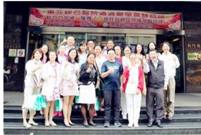
代表团和东元医院领导合影