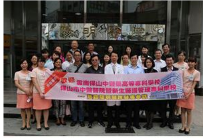
代表团和阳明医院领导合影