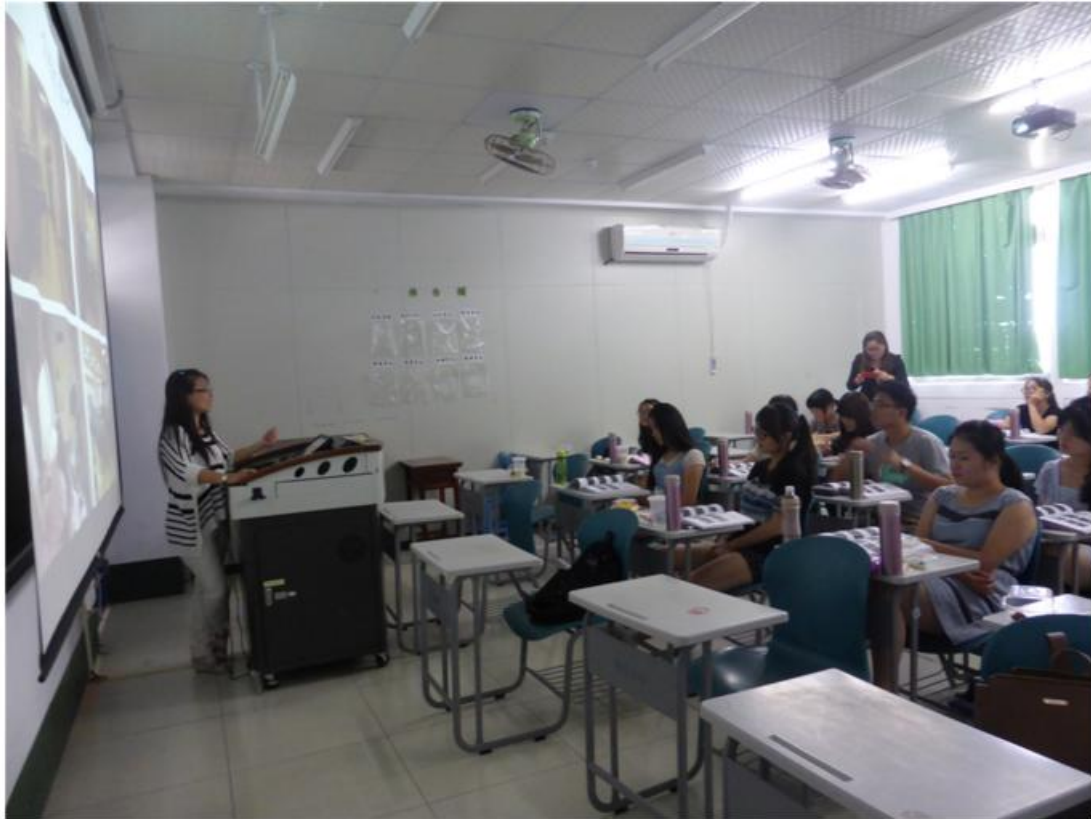
学生们在上课听讲