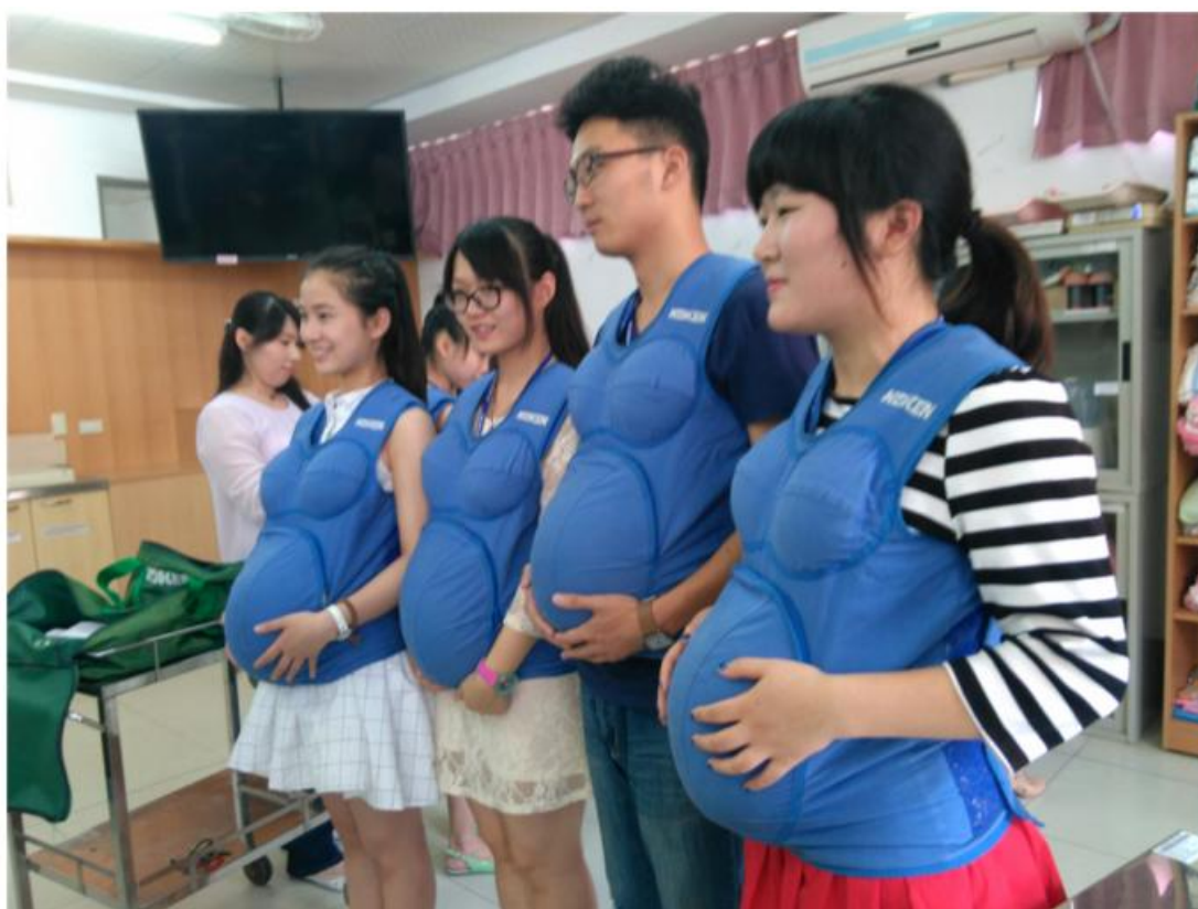
学生在上课体验孕妇装