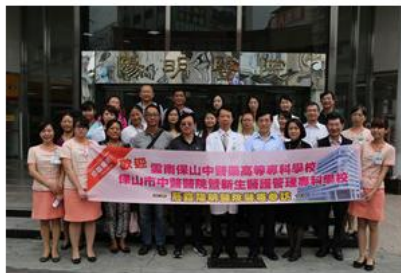
代表团和阳明医院领导合影