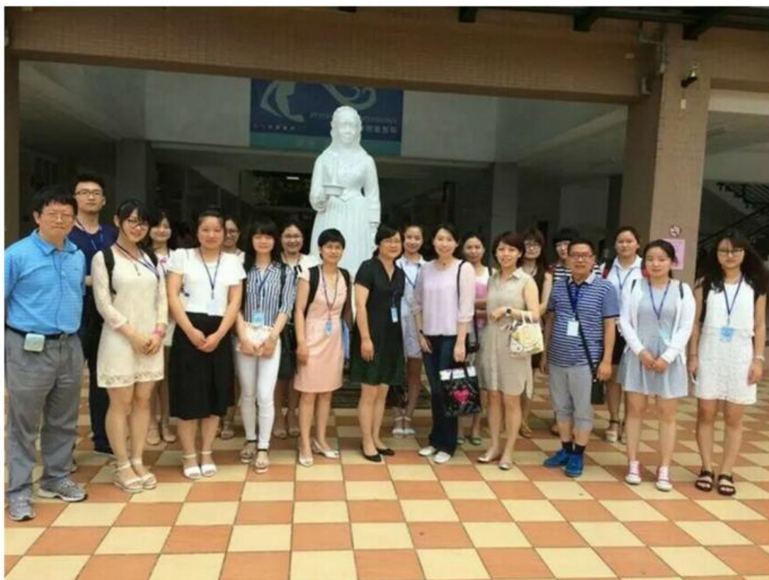
在新生医护管理专科学校