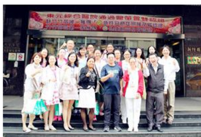
代表团和东元医院领导合影